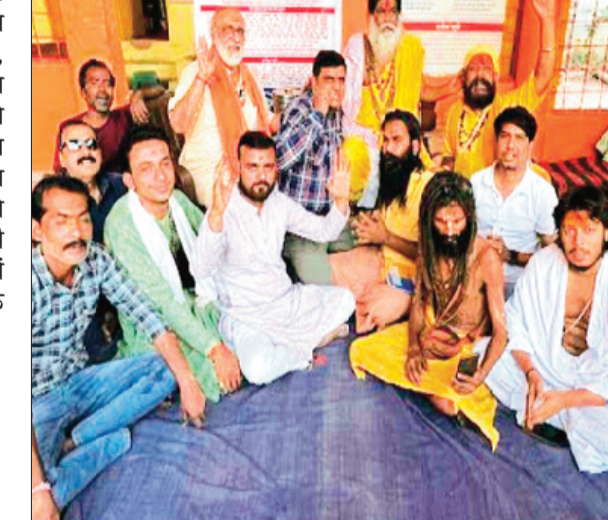
हरिभूमि न्यूज ►► सीहोर