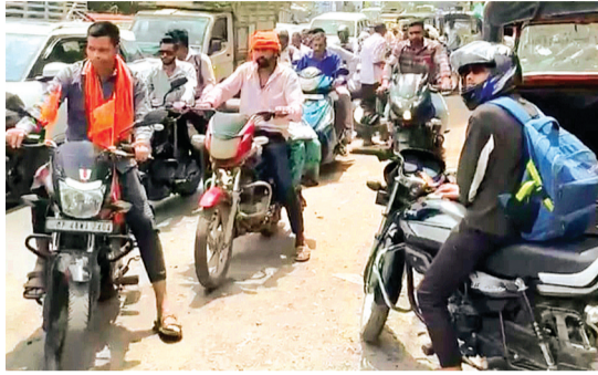
हरिभूमि न्यूज ॥ बैतूल

तीसरी रेलवे लाइन और अंडरब्रिज की लंबाई बढ़ाने के कारण रेलवे ने 3 अप्रैल से 45 दिनों के लिए वाहनों की आवाजाही पर प्रतिबंध लगा दिया है। अंडरब्रिज का रास्ता बंद होने से पूरा ट्रैफिक सदर ओवरब्रिज पर शिफ्ट हो गया है, जिससे बार-बार ट्रैफिक जाम के हालात बन रहे हैं। हालांकि वाहन चालकों को परेशानी न हो, इसके लिए ट्रैफिक पुलिस ने ओवरब्रिज से भारी वाहनों के प्रवेश पर रोक लगा दी है। भारी वाहन और बसें सोनाघाटी से होकर शहर में प्रवेश करेगी। लेकिन इसके बाद भी ओवरब्रिज पर ट्रैफिक जाम की समस्या कम नहीं हुई है। हालात यह है कि सुबह और शाम के समय ओवरब्रिज के दोनों तरफ बार-बार जाम की स्थिति निर्मित हो रही है। बता दें कि मध्य रेल, बैतूल के निर्माण विभाग द्वारा जारी सूचना के अनुसार, बैतूल रेलवे स्टेशन के इस्टर्सी छोर पर रेलवे किलोमीटर 850/41-43 के बीच स्थित अंडरपास में तीसरी लाइन